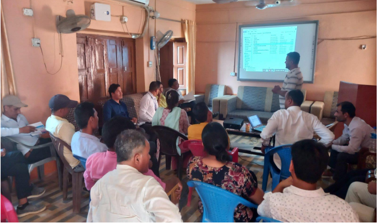
मस्यौदा प्रतिवेदनमाथि छलफल कार्यक्रम