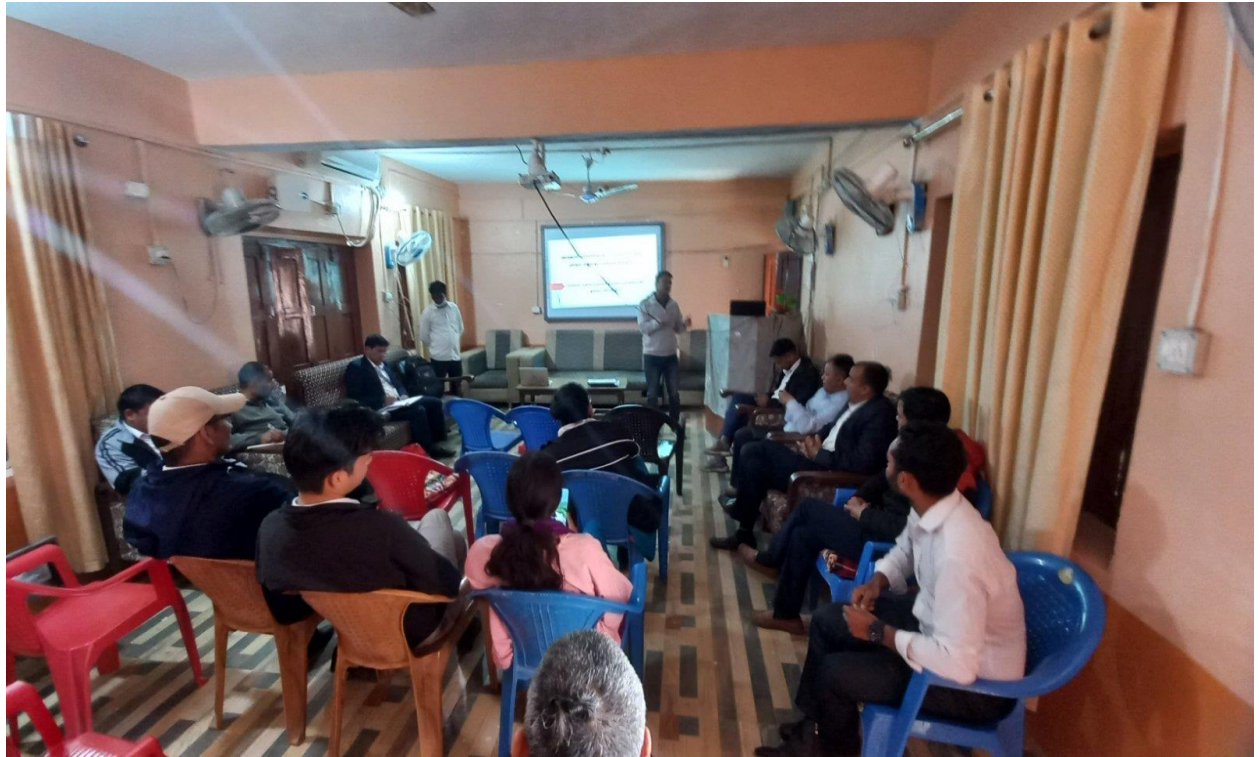
प्रारम्भिक छलफल तथा अभिमुखिकरण कार्यक्रम