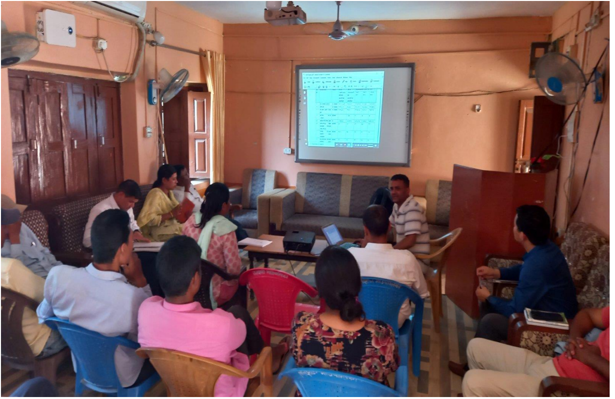
मस्यौदा प्रतिवेदनमाथि छलफल कार्यक्रम